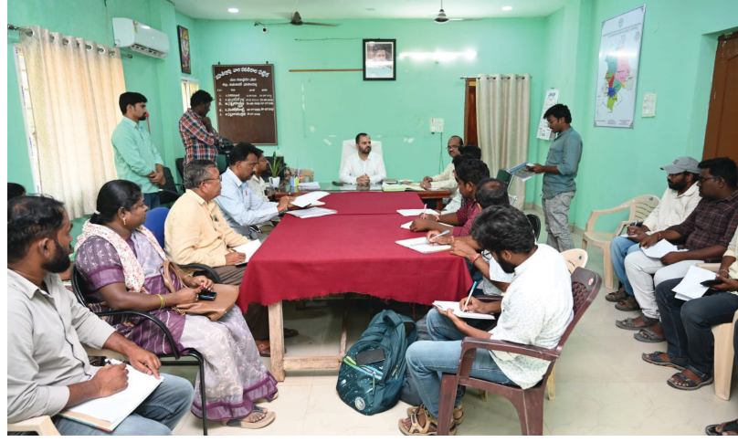
కార్డుల జారీ ప్రక్రియ, ఇందిరమ్మ ఇండ్ల నిర్మాణ వేగవంతంపై అధికారులు దృష్టి సారించిన తెలిపారు. పంట పొలాలు ఎండిపోకుండా అధికారులు సమన్వయంతో పనిచేయాలని తెలిపారు. ప్రతి వారం సాగు నీటిపై మండల స్థాయిలో యాసంగి పంటకు నీటి నిర్వహణపై సమీక్షించి నిర్వహించి సమన్వయ పరిష్కారానికి చర్యలు తీసుకోవాలని సూచించారు. యాసంగి పంటకు నీటి నిర్వహణపై ప్రతి మండలంలో రెవెన్యూ, వ్యవసాయ, నీటిపారుదల శాఖ అధికారులు సాగునీటి పంటకు నీరు అందించేందుకు చర్యలు తీసుకోవాలని తెలిపారు. సాగునీరు సమన్వయం చేసుకొని చర్యలు తీసుకోవాలని అన్నారు. సూతన రేషన్ కార్డులు ధరభాస్సులు క్షేత్రస్థాయిలో పర్యటించి అర్హులను గుర్తించాలని సూచించారు. ఈ సమావేశంలో తహసీల్దార్ సత్యనారాయణ స్వామి, పంచాయతీ, వ్యవసాయ, ఇరిగేషన్ అధికారులు తదితరులు పాల్గొన్నారు.

* జిల్లా కలెక్టర్ రాహుల్ శర్మ జయశంకర్ భూపాల్ పల్లి మార్చి 26 (సమయం న్యూస్): ప్రజలకు మరింత మెరుగైన సేవలు అందించేందుకు అన్ని శాఖల అధికారులు సమర్థంగా, సమన్వయంతో పని చేయాలని జిల్లా కలెక్టర్ రాహుల్ శర్మ తెలిపారు. బుధవారం గణపూరం తహసీల్దార్ కార్యాలయంలో సూతన రేషన్ కార్డులు విచారణ, త్రాగు, సాగు నీరు, ఎలెక్ట్రీసిటీ తదితర అంశాలపై రెవెన్యూ, పంచాయతీ రాజ్, ఇరిగేషన్, వ్యవసాయ శాఖల అధికారులతో సమావేశం నిర్వహించారు. సంబంధిత శాఖల అధికారులు తమ విభాగాలకు సంబంధించిన ప్రస్తుత పరిస్థితిని వివరించారు. ప్రజలకు అందుతున్న సేవలను మరింత మెరుగుపరిచేందుకు తీసుకోవాల్సిన చర్యలపై చర్చించారు. ముఖ్యంగా తాగు, సాగునీటి సమస్యల పరిష్కారం, ఉపాధి హామీ పనుల పురోగతి, రేషన్