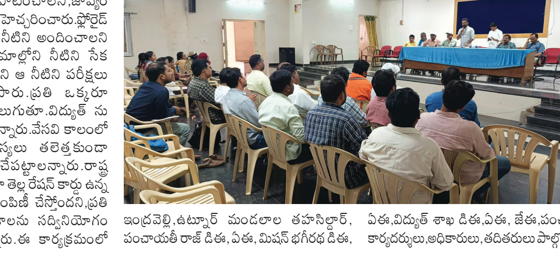
ఇంద్రవెల్లి, ఉటూర్ మండలాల తహసీల్దార్, ఏ ఈ, విద్యుత్ శాఖ డి. ఈ, డి. ఈ, పంచాయతీ పంచాయతీ రాజ్ డి. ఈ, ఏ ఈ, మిషన్ భగీరథ డి. ఈ, కార్యదర్శులు, అధికారులు, తదితరులు పాల్గొన్నారు.

నాణ్యత ప్రమాణాలు పాటించాలని, జాప్యం వహిస్తే సహించేది లేదని హెచ్చరించారు. ఛోరైడ్ డి. ఉన్న గ్రామాల్లో మంచి నీటిని అందించాలని సూచించారు. అన్ని గ్రామాల్లోని నీటి సేకరించి తన వద్ద ఇవ్వాలని ఆ నీటిని పరీక్షలు నిర్వహిస్తామని తెలిపారు. ప్రతి ఒక్కరూ బాధ్యతాయుతంగా మెలుగుతూ, విద్యుత్ ను పొదుపుగా వాడాలని అన్నారు. వేసవి కాలంలో గ్రామాల్లో నీటి సమస్యలు తలెత్తకుండా అధికారులు చర్యలు చేపట్టాలన్నారు. రాష్ట్ర ప్రభుత్వం ప్రతిష్టాత్మకంగా తెలంగాణ రాష్ట్ర ఉన్న వారికి సన్న బియ్యం పంపిణీ చేస్తోందని, ప్రతి ఒక్కరూ ప్రభుత్వ పథకాలను సద్వినియోగం చేసుకోవాలని పేర్కొన్నారు. ఈ కార్యక్రమంలో