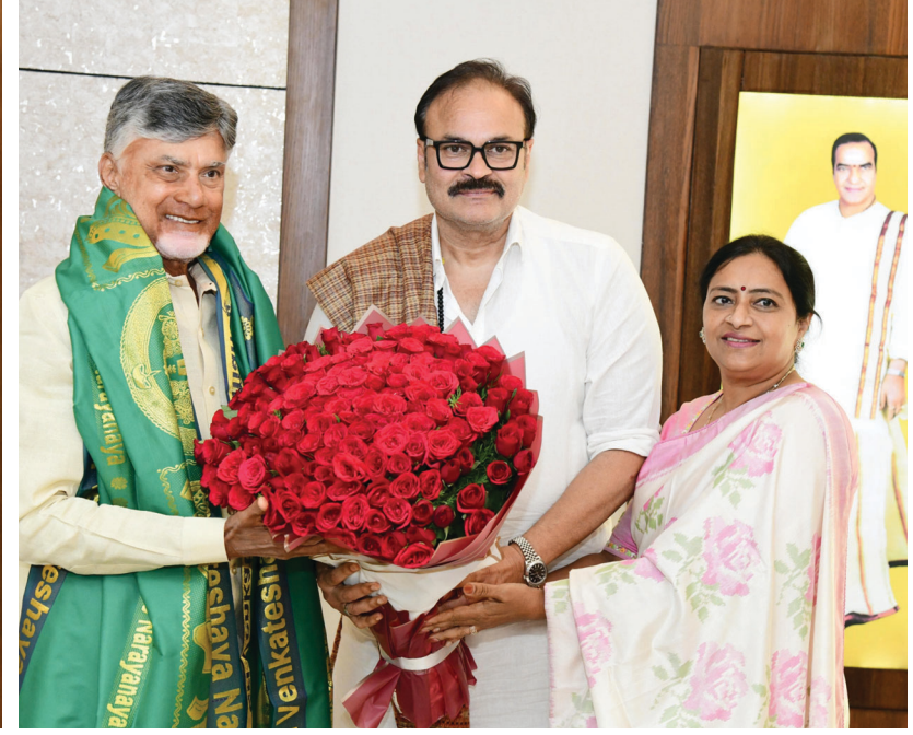
ముఖ్యమంత్రి చంద్రబాబు నాయుడు గారిని ఎమ్మెల్సీ నాగబాబు గారు మర్యాదపూర్వకంగా కలిశారు. శాసనమండలి చైర్మన్ కార్యాలయంలో ఎమ్మెల్సీ గా ప్రమాణ స్వీకారం చేసిన అనంతరం నాగబాబు సచివాలయంలో సీఎంను కలిశారు.