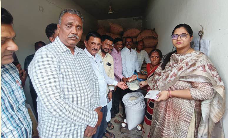
ప్రారంభించిన అన్నారు. ప్రభుత్వం పంపిణీ చేసే ఫోర్టిఫైడ్ రేషన్ బియ్యం