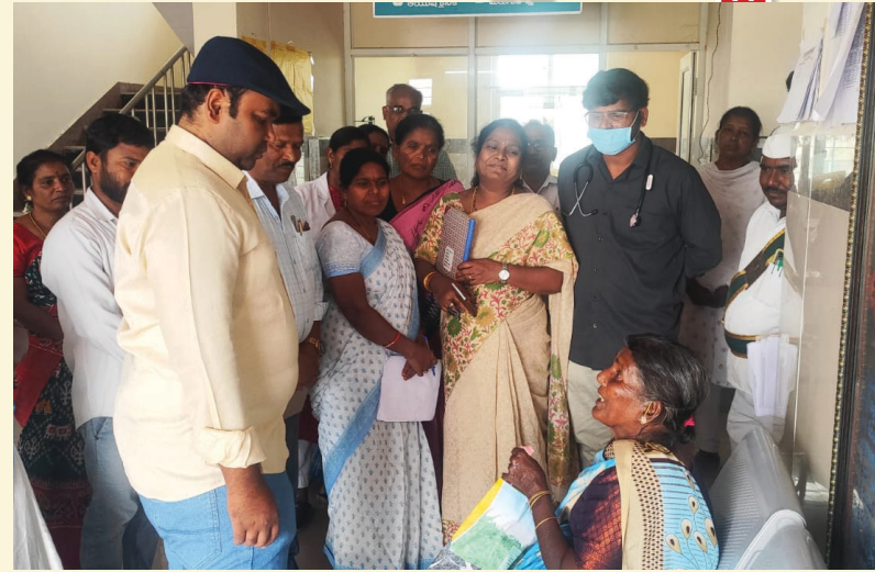
ఆరా తీశారు. పలువురు బాలింతలతో మాట్లాడారు. ఈ సందర్భంగా కలెక్టర్

మెదక్ ఏప్రిల్ 01, (సమయం న్యూస్) : మంగళవారం క్షేత్రస్థాయి పర్యటనలు భాగంగా మనోరబాద్ మండలం కలెక్టర్ ప్రభుత్వ ఆసుపత్రిని ఆకస్మికంగా తనిఖీ చేసారు. సిబ్బంది హాజరు రిజిస్టర్, ఓపి రిజిస్టర్, మందులు నిల్వచేయ స్టోర్ రూమ్, పరిశీలించారు. ఆయా వార్డుల్లో రోగులతో నేరుగా మాట్లాడి, వారికి అందుతున్న సేవలపై