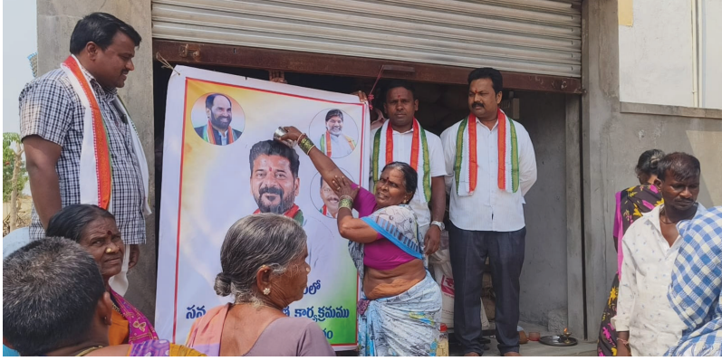
ఈ సందర్భంగా వారు మాట్లాడుతూ సీఎం రేవంత్ రెడ్డి నాయకత్వంలో కాంగ్రెస్ ప్రభుత్వం ప్రజలకు ఎంతో మేలు చేస్తుందన్నారు. ఎక్కడా లేనివిధంగా మహిళలకు ఉచిత బస్సు ప్రయాణం, రూ. 500 ల గ్యాస్ సబ్సిడీ అమలు చేశారన్నారు.