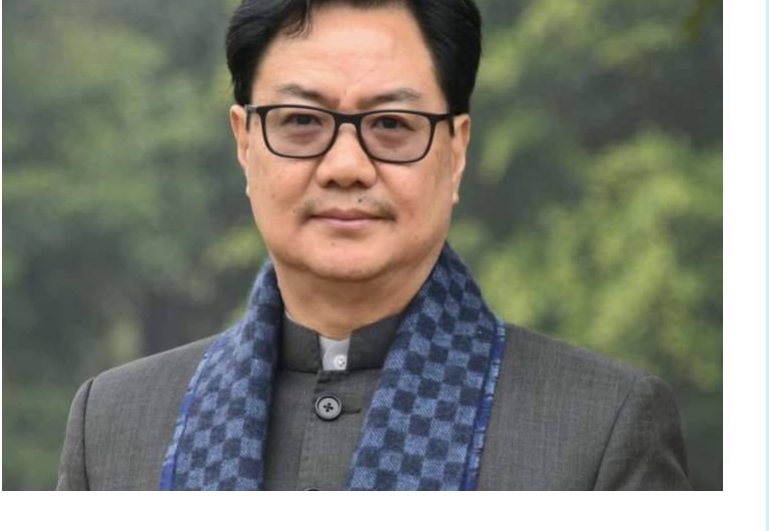
న్యూఢిల్లీ, నవంబర్ 19 (సమయం న్యూస్):