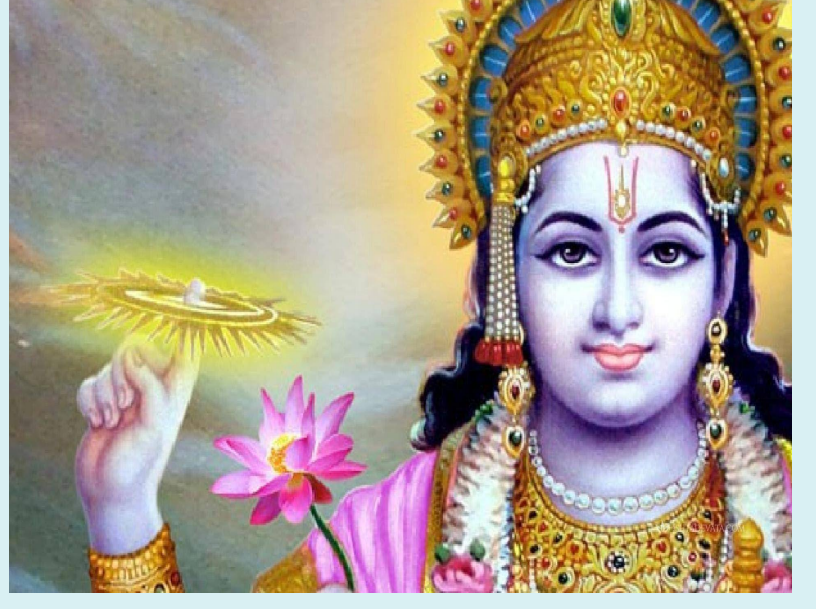
తిరుమల, నవంబర్ 19 (సమయం న్యూస్):