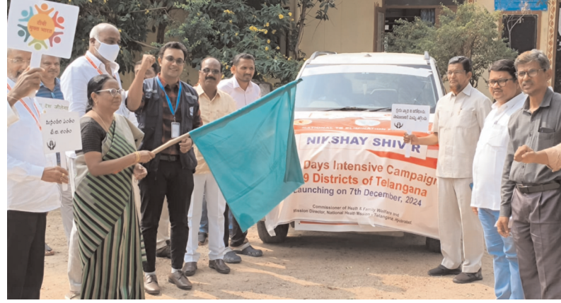
రాజన్న సిరిసిల్ల, డిసెంబర్ 07 (సమయం న్యూస్) :