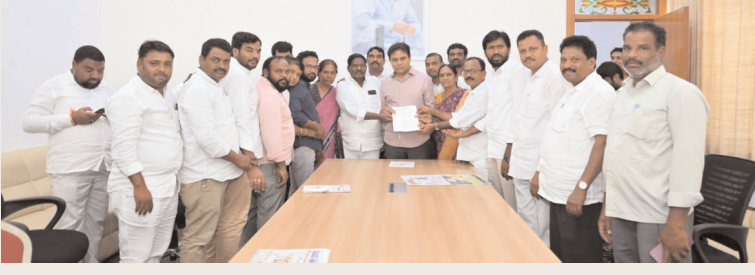
రాజన్న సిరిసిల్ల, డిసెంబర్ 07 (సమయం న్యూస్) :

అసెంబ్లీ సమావేశాల్లో సర్పంచ్ల సమస్యను లెవనెత్తుతామని కేటీఆర్ హామీ