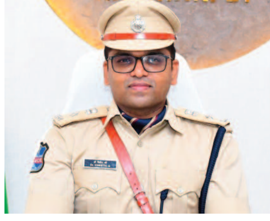
గ్రామ సభలలో డిఫెన్స్ డ్రైవింగ్ పై విస్తృతంగా అవగాహన కల్పిస్తున్నామని మరియు కమిటీలు ఏర్పాటు చేసి నిరంతరం